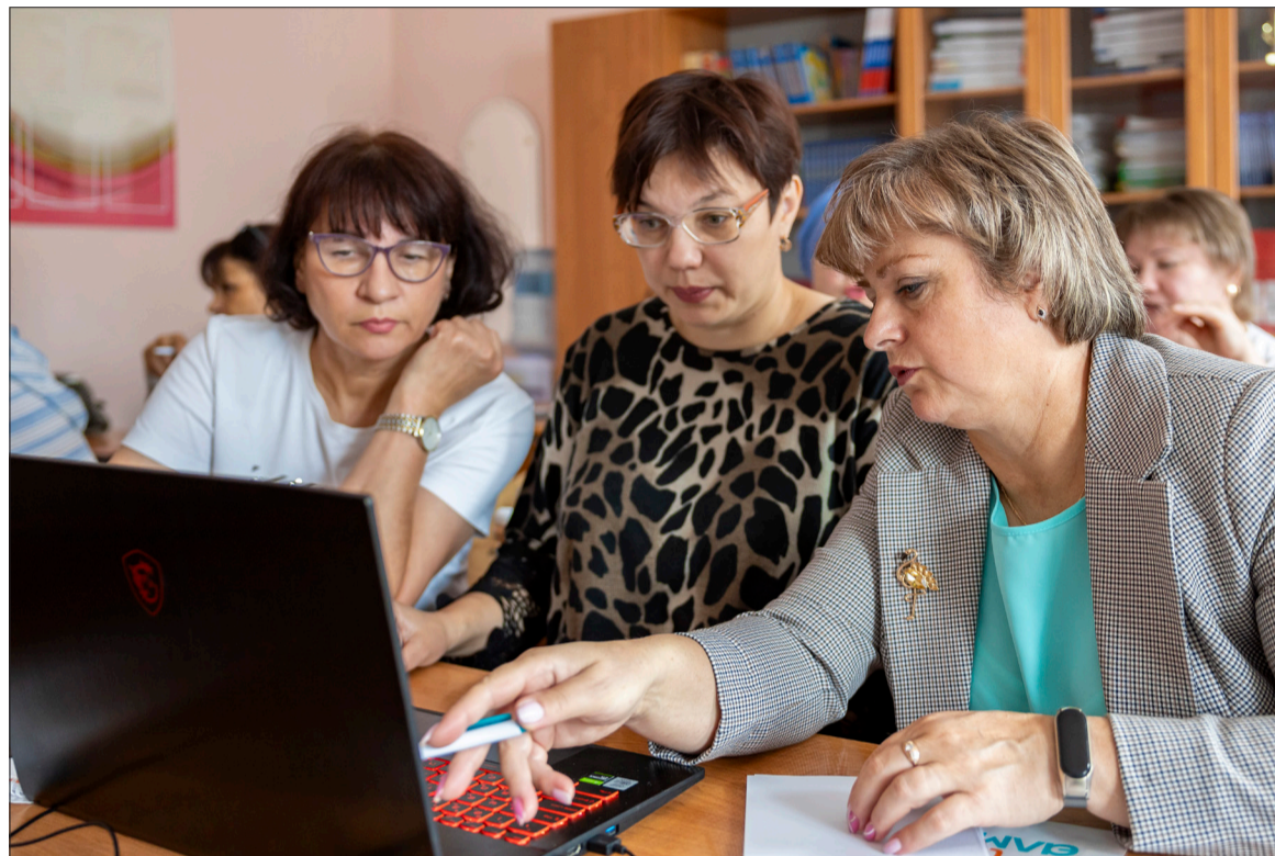
В секции «Основы дизайна презентации» педагоги создавали слайды для урока по биологии.