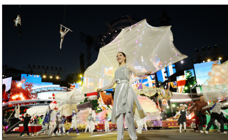
Впервые праздничный парад на площади Ленина проходил в вечернем формате

С поздравительной речью к нефтяникам обратился генеральный директор Компании Наиль Маганов: